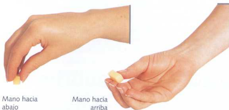
Mano hacia abajo