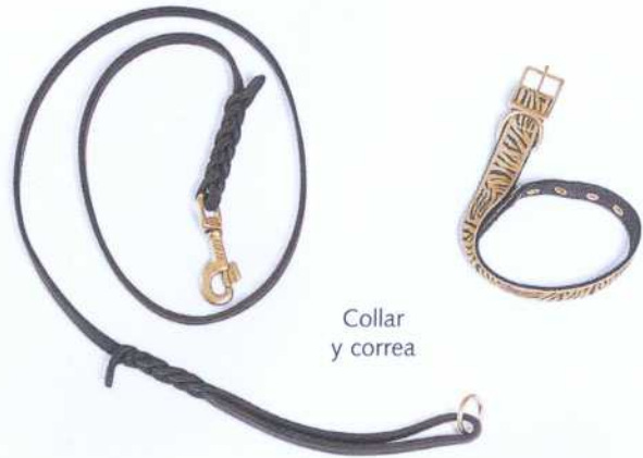
Collar y correa

Necesitaremos la correa sólo si el perro tiene que empezar por el adiestramiento básico (véase pg. 20). La mayoría de los ejercicios se enseñan mejor sin correa. Elijamos un collar fijo de cuero de un grosor que se adapte al cuello del perro y ajustémoslo de manera que quepan dos dedos por debajo del collar. La correa tendría que ajustarse bien a nuestra mano y con un grosor y una longitud acordes al tamaño del perro, pero no tendrá que ser nunca tan larga que no nos permita tensarla.